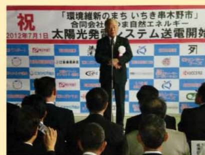
松下忠洋郵政・金融担当国務大臣